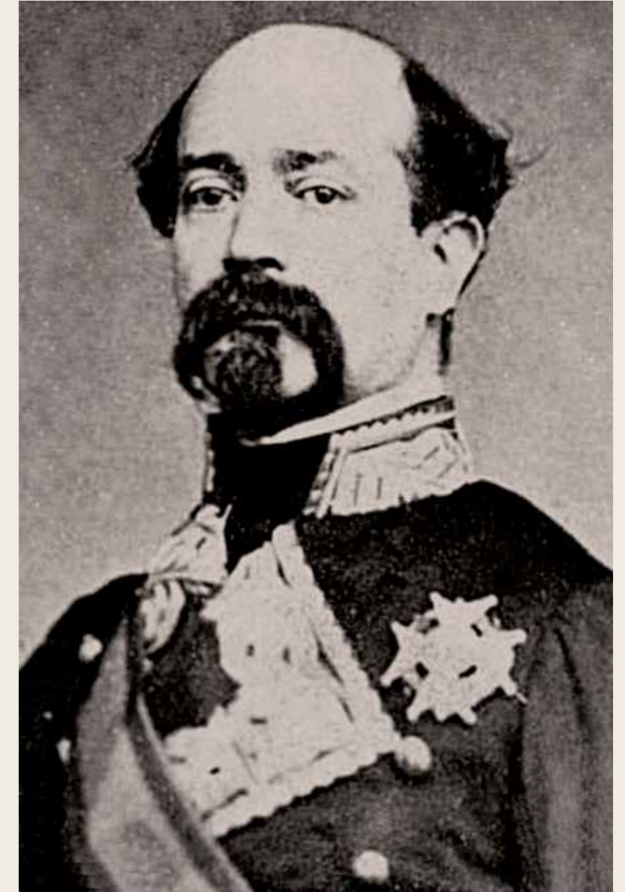
Manuel Pavia, el capità general de Catalunya que va promoure aquest projecte

La primera línia d'aquest telègraf seria la de Barcelona a Lleida. És dins d'aquest context que trobem la notícia de la construcció, durant el mes de maig de 1848, d'una estació del telègraf al cim de la muntanya de Sant Pere Màrtir. Ho van fer tot aprofitant les restes del fortí que els soldats napoleònics havien bastit durant la Guerra del Francès, aprofitant l'ermita dedicada al màrtir dominic Sant Pere de Verona.