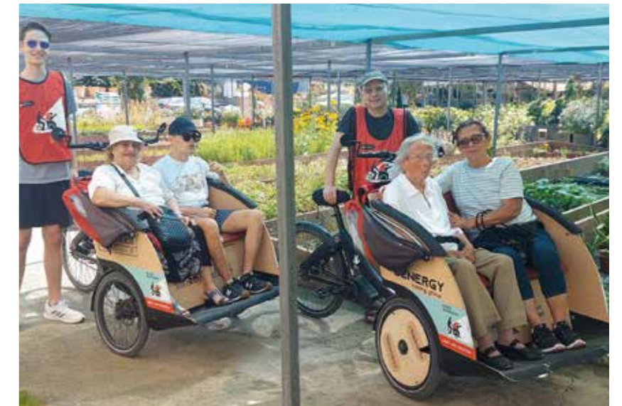
El servei permet una passejada lúdica...

Per a més informació o per a donar suport al projecte d'EBSE a Sant Just, bé sigui fent-vos socis, col·laboradors o voluntaris, podeu dirigir-vos a https://enbicisenseedat.cat/contacte/ . En aquest moment, hi ha prevista una formació per a persones interessades a formar part del voluntariat. Serà el 29 de setembre, sessió teòrica en línia, de 17:30 a 19, i una de pràctica, en data a determinar. <