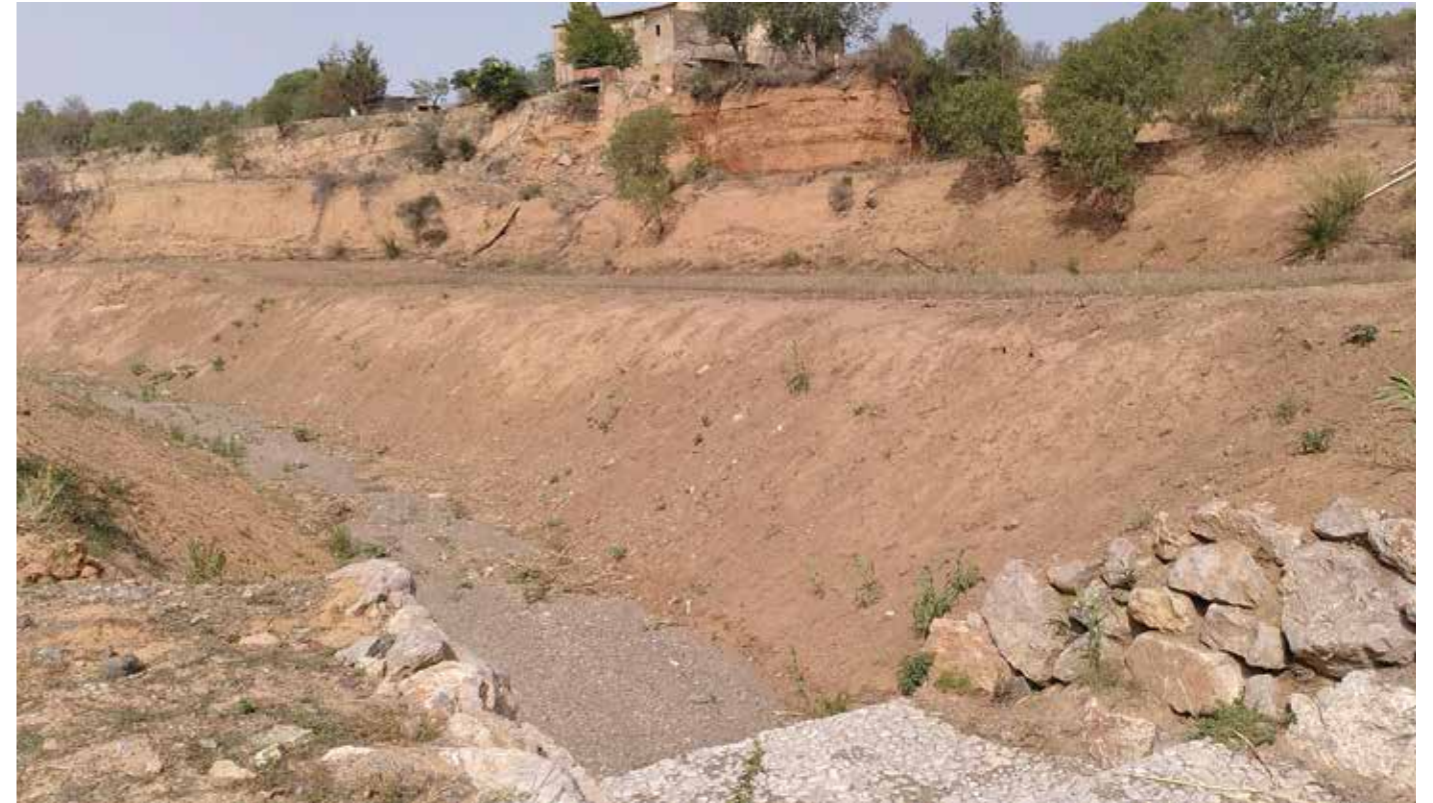
Zona Can Roldán, 05/09/2023. Gran excavació amb perfils amb molt pendent. Es veu com la canya comença a sortir. Si no es fa res, acabarà com a Can Mèlich

Tampoc s'ha intentat seguir el que la dinàmica fluvial demana. En aquesta zona, en lloc d'aprofundir el riu s'hauria hagut d'eixamplar, disminuint el pendent. Això s'ha de fer construint terrasses en la zona de ribera i plantant, altra volta, arbres que fixin el terreny (un que ho feia l'han mig descalçat i s'ha mort). O sigui que no podem felicitar l'Ajuntament per la seva actua-