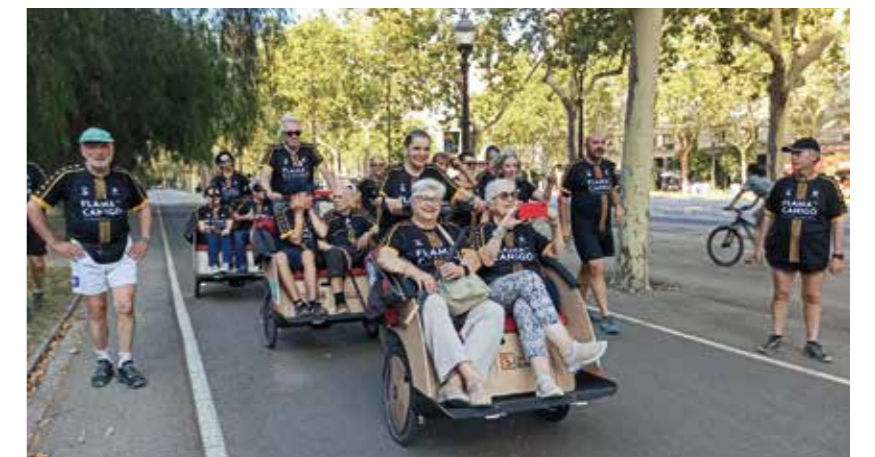
...o també participar en les celebracions tradicionals i reivindicatives. Aquí, durant la darrera celebració de la Flama del Canigó