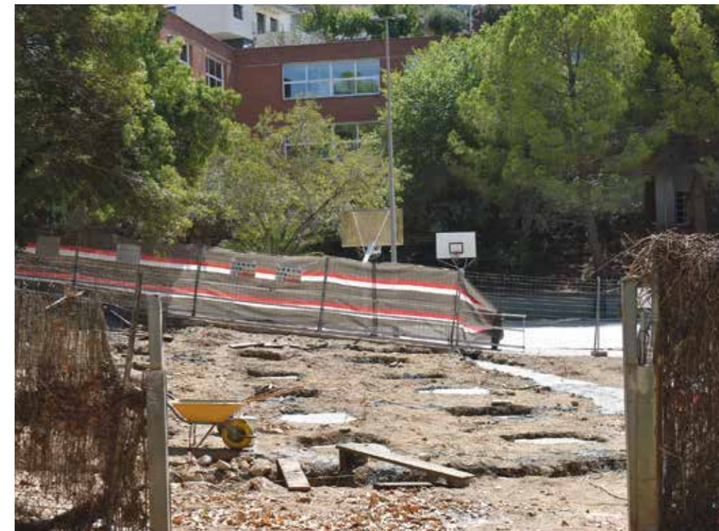
Foto antiga: Postal de Sant Just Desvern