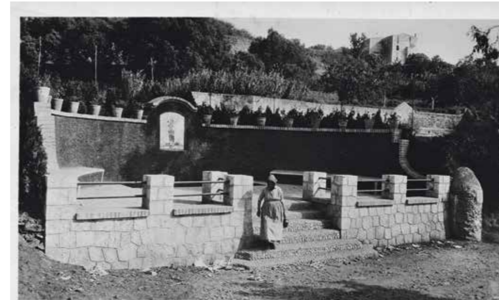
SANT JUST DESVERN - 12

L'any 1975 s'iniciava el procés per la construcció de l'Institut, que començaria a funcionar el 1978. No es va tenir la valentia de fer un urbanisme ben planificat i es va optar per agafar amb presses una pastilla de terreny en el plànol i construir un equipament bàsic als afores del centre urbà, és a dir, a la quinta nata.<