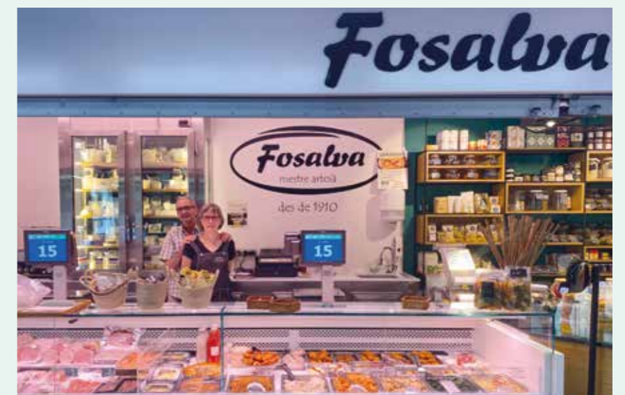
El Just i l'Assun, a la parada actual del Mercat

La cansaladeria Fosalva fa 114 anys que ven porc als santjustencs i santjustenques. No sabem si per molt més temps, ja que no se sap si cap Fosalva en farà el relleu. És una història 100% santjustenca, una història de tradició, constància i passió. <