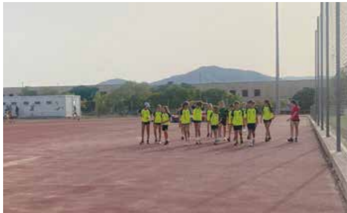
Haver d'entrenar fora de Sant Just suposa per al Club un greuge comparatiu amb els clubs d'altres especialitats esportives, ja que s'han de desplaçar i han de pagar un lloguer

L'Quan es va crear el club, poder entrenar a Sant Just i, per tant, tenir una pista d'atletisme reglamentària al municipi, per petita