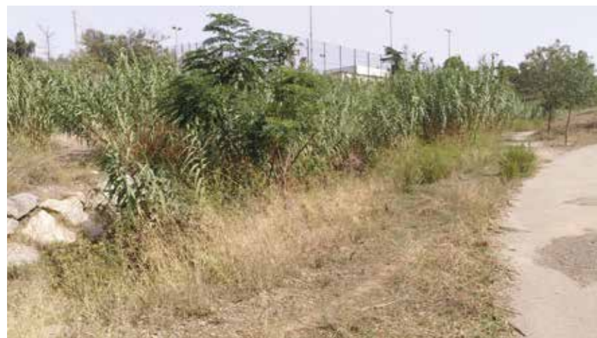
Zona Can Mèlich. A dalt, quan es va estassar la canya (26/02/2023). A sota, la canya s'ha recuperat totalment (05/09/2023)

tat es vol fer un control del seu creixement i no un "pintat de verd abans de les eleccions". I les úniques solucions són aquelles que es basen en el funcionament de la naturalesa (SBN: Solucions basades en la naturalesa).