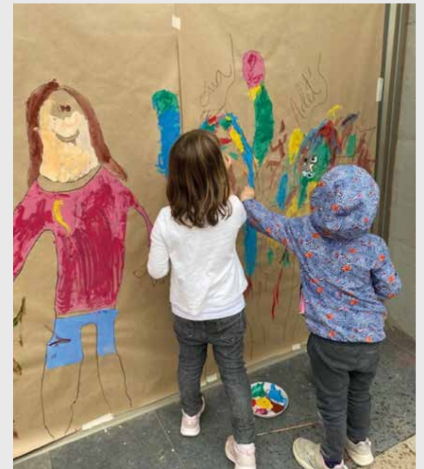
Infants pintant a la Plaça de la Pau. "Divendres al parc" (maig de 2023)

Per contactar, rebre informació o convocatòries, escriure a: xarxa06santjust@gmail.com. <