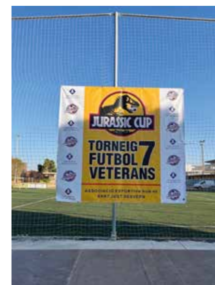
Cartell promocional de la setena edició de la Juràssic Cup

En un inici eren un grup de pares de jugadors de l'Atlètic que es reunien els diumenges a les vuit del matí per a jugar a futbol. El mateix Atlètic els cedia les pilotes, els petos i altres materials. En el seu origen, aquest grup de pares competia representant a l'Atlètic Sant Just. Si més no, durant els anys el grup de pares va anar creixent i finalment van decidir crear l'Associació Esportiva Sub 60, l'any 2018, per facilitar l'organització.