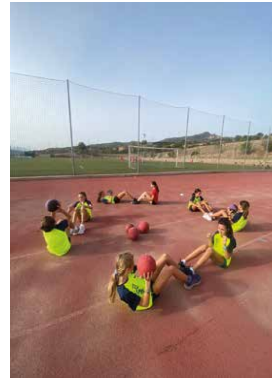
Malgrat les dificultats, el Club s'ha consolidat i està donant fruits, gràcies al bons resultats esportius dels seus atletes

Si més no, els desavantatges d'entrenar al poble veí són més que els petits avantatges que hi poden existir. Un dels problemes de Sant Feliu és que la pista d'atletisme, tot i ser reglamentària, no està homologada per dur a terme competicions. Això fa que el club no pugui organitzar competicions i, per tant, deixi d'ingressar diners per la realització d'aquestes. A més a més, qualsevol activitat que vulgui organitzar el club a les instal·lacions de Sant Feliu sempre ha d'anar a càrrec del club, ja que